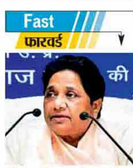
Fast फारवर्ड की

सीएए शोषित पाकिस्तानी मुसलमानों क्यों नहीं नई दिल्ली. ए. बसपा अध्यक्ष मायावती ने संशोधित नागरिकता कानून (सीएए) में पाकिस्तान के शोषित पीड़ित अल्पसंख्यकों के साथ मुस्लिमों को भी नागरिकता देने की पेशी करते हुए इस मामले में सरकार के फैसले पर प्रश्नचिह्न लगाया है. मायावती ने मंगलवार को ट्वीट कर कहा, 'पाकिस्तानी मूल के गायक अद्वान सामी को जब भाजपा सरकार नागरिकता एवं पदवी देने की सम्मानित कर सकती है तो फिर जुलूम-ज्यादती के शिकार पाकिस्तानी मुसलमानों को क्यों के हिन्दू, सिख, ईसाई आदि की तरह यहाँ सीएए के तहत पनाह क्यों नहीं दे सकती है?' उन्होंने सीएए पर सरकार से पुनर्विचार करने का अनुरोध करते हुए कहा, 'अतः केन्द्र सीएए पर पुनर्विचार करे तो बेहतर होगा.'