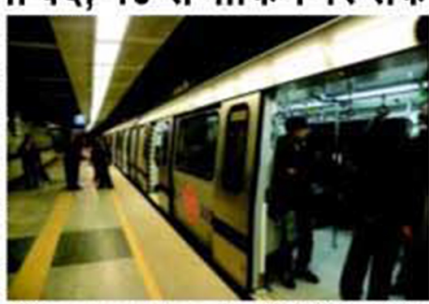
दिल्ली मेट्रो के चार स्टेशनों पर आवाजाही रहेगी बंद, 98 से पार्किंग पर रोक

नई दिल्ली : स्वतंत्रता दिवस पर सुरक्षा व्यवस्था के चलते दिल्ली मेट्रो की सेवाएं किसी तरह प्रभावित नहीं होंगी। डीएमआरसी द्वारा जारी निर्देश के अनुसार 15 अगस्त के दिन दिल्ली मेट्रो की सेवाएं सामान्य रूप से चलेंगी लेकिन बॉयलट लाइन के चार स्टेशनों पर कुछ पाबंदी होगी। गौरतलब है कि सुरक्षा व्यवस्था के चलते बॉयलट लाइन के चार स्टेशनों ताल किला, जामा मस्जिद, दिल्ली गेट और आईटीओ के कुछ चुनिंदा द्वार से ही स्टेशन के अंदर प्रवेश और निकासी होगी। अन्य द्वार पूरी तरह से बंद रहेंगे। 15 अगस्त पर मेट्रो स्टेशन गते ही खुले रहेंगे लेकिन 14 अगस्त को सुबह 6 बजे से ही सभी स्टेशनों के बाहर पार्किंग बंद हो जाएगी। वाहन पार्किंग व्यवस्था 15 अगस्त दोपहर 2 बजे तक बंद रहेगी।