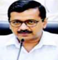
कि विकसित देशों में होता है। मुझे खुशी है कि हमारे प्रयास सफल हो रहे हैं।" केजरीवाल ने टीवीट किया, "अब हम यह सुनिश्चित करने के लिए भी कड़ी मेहनत कर रहे हैं कि आपको आपके नल में पानी 24 घंटे मिले।"

नयी दिल्ली। दिल्ली के मुख्यमंत्री अरविंद केजरीवाल ने मंगलवार को कहा कि दिल्ली जल बोर्ड यह सुनिश्चित करने के लिए कड़ी मेहनत कर रहा है कि शहर में नलों से आने वाला पानी पीने योग्य हो और इसे शुद्ध करने के लिए रिवर्स ऑस्मोसिस प्यूरीफायर की जरूरत न पड़े। मुख्यमंत्री जल बोर्ड के अध्यक्ष भी है। उन्होंने कहा कि बोर्ड अब यह सुनिश्चित करने के लिए काम कर रहा है कि दिल्ली के लोगों को 24 घंटे पानी की आपूर्ति हो। उन्होंने कहा, "दिल्ली जल बोर्ड यह सुनिश्चित करने के लिए कड़ी मेहनत कर रहा है कि आपके नल में जो पानी आता है वह पीने योग्य हो और इसे शुद्ध करने के लिए आपकी आरखों की आवश्यकता न पड़े, जैसा