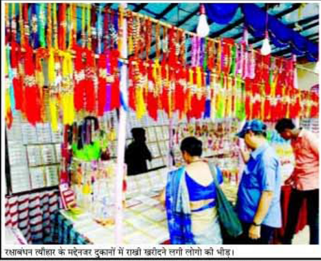
रक्षाबंधन त्यौहार के मद्देनजर दुकानों में राखी खरीदने लगें लोगो को भीड़।

को हटाने संबंधी याचिका दिन का समय लगेंगा। पर तत्काल दिशानिर्देश देने से इंकार कर दिया है। कोर्ट ने कहा कि सरकार को राज्य यह सुनिश्चित करना है कि में हालात सामान्य करने के जम्मू कश्मीर में कानून लिए समुचित समय दिया व्यवस्था बनी रहे। बता दें जाणा चाहिए। ये याचिका तहसीन पूनावाला साध ही केंद्र ने न दायर की थी। जिसमें आतंकवादी बुरहान वानी की कर्फ्यू को हटाने, फोन मुहंभेड में मोत के बाद लाइन्स को दोबारा शुरू करने कश्मीर में जुलाई 2016 में और इंटरनेट, न्यूज चैनल हुए विरोध प्रदर्शन का हवाला और बाकी सभी तरह की देते हुए कोर्ट को बताया कि पाबंदियों को हटाने के लिए हालात सामान्य होने में कुछ कहा है।