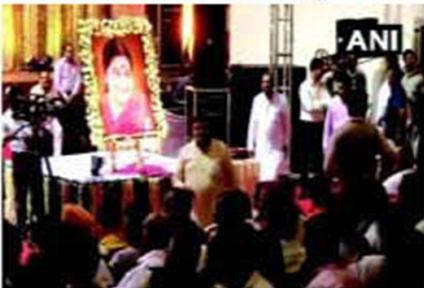
हमें काफी कुछ देकर गई हैं, हैं। उस विरासत को संवारना और सजाना हमारा कर्तव्य का छह अगस्त को रात में सुषमा के रूप में सुषमा जी

नई दिल्ली : दिल्ली के जवाहरलाल नेहरू स्टेडियम में पूर्व विदेश मंत्री सुषमा स्वराज के लिए शोक सभा का आयोजन किया गया। इस शोक सभा में पीएम मोदी के अलावा गृह मंत्री अनिल शाह के अलावा भाजपा के तमाम बड़े नेता मौजूद थे। इस दौरान पीएम मोदी ने कहा- वह अपने विचारों को लेकर बेहद दृढ़ थीं और वह उनपर अडिग भी रही। उनका भाषण न सिर्फ प्रभावी होता था बल्कि प्रेरणादायक भी होता था। पीएम मोदी ने कहा कि एक कार्यकर्ता और और सजाना हमारा कर्तव्य का छह अगस्त को रात में सुषमा के रूप में सुषमा जी