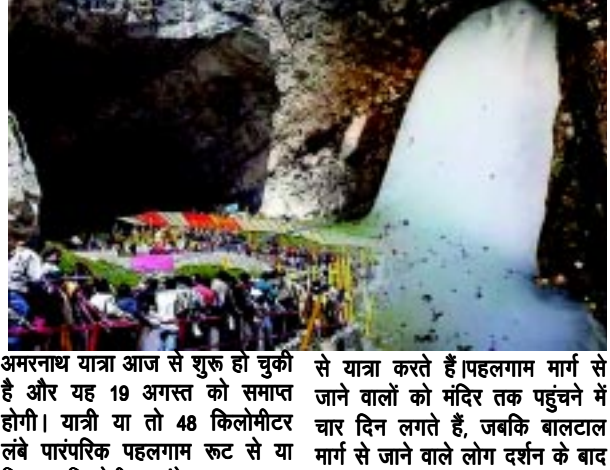
अमरनाथ यात्रा आज से शुरू हो चुकी है और यह 19 अगस्त को समाप्त होगी। यात्री या तो 48 किलोमीटर लंबे पारंपरिक पहलगाम रूट से या फिर 14 किलोमीटर लंबे बालटाल रूट से यात्रा करते हैं। पहलगाम मार्ग से जाने वालों को मंदिर तक पहुंचने में चार दिन लगते हैं, जबकि बालटाल मार्ग से जाने वाले लोग दर्शन के बाद उसी दिन वापस लौट आते हैं।

जम्मू पवित्र अमरनाथ यात्रा आज यानी 29 जून से शुरू हो चुकी है। भारी सुरक्षा के बीच तीर्थयात्रियों का दूसरा जत्था जम्मू से रवाना हुआ। अधिकारियों ने बताया कि 4,029 यात्रियों का दूसरा जत्था 200 वाहनों के दो सुरक्षा काफिलों में जम्मू के भगवती नगर यात्री निवास से कश्मीर घाटी के लिए रवाना हुआ। अधिकारियों ने कहा, इनमें से 1,850 यात्री सुबह 4 बजे 104 वाहनों में बालटाल बेस कैम्प के लिए रवाना हुए, जबकि 2,179 यात्री 96 वाहनों में सवार होकर सुबह 4.30 बजे पहलगाम के नुनवान बेस कैम्प के लिए रवाना हुए। अधिकारियों ने बताया, दोनों काफिलों को सुरक्षा प्रदान की जा रही है। 52 दिनों तक चलने वाली