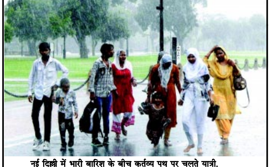
नई दिल्ली में भारी बारिश के बीच कर्तव्य पथ पर चलते यात्री.